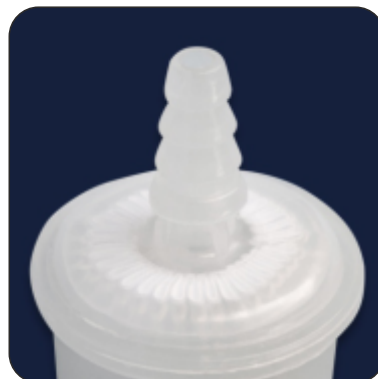
1/4" Multi Stepped HB