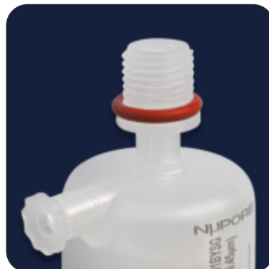
1/4" MNPT with SS Ring