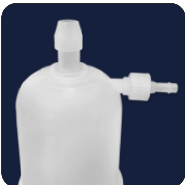
1/2" Single Stepped HB