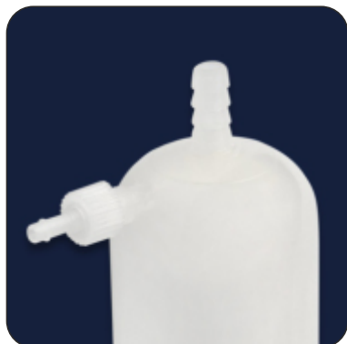
1/2" Multi Stepped HB