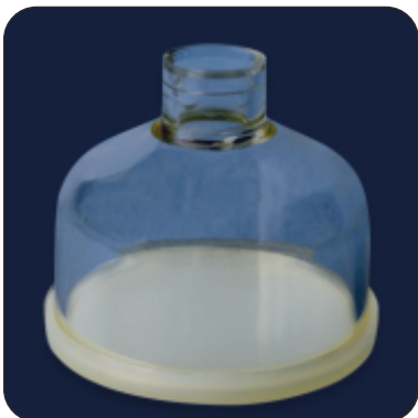
Bell with Cover