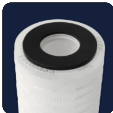
BEO Standard Length