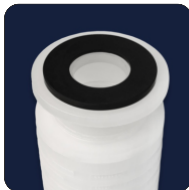
BEO Extra Length